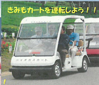
きみもカートを運転しよう!!