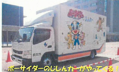
ポーサイダーのじしんカーがやってくる!!